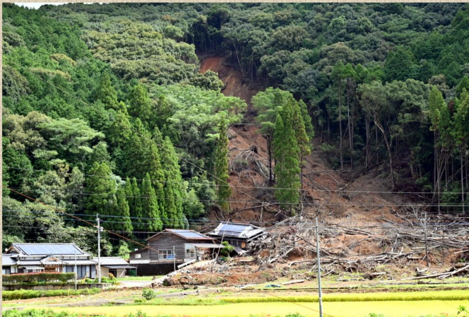
施設から 2 Km上流付近で発生した山地崩壊現場（犠牲者 3 名）