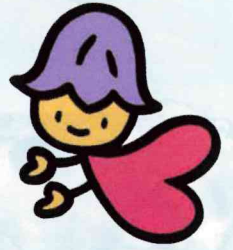
熊本県人権啓発キャラクター コッコロ

県民一人一人に人権尊重の意識が根付き、 全ての人の基本的人権が尊重・保障され、 誰もが幸せに安心して自分らしく生きることができる社会。 そんな社会をつくるために、あなたの力が必要です。 自己実現と幸福追求が満たされる 「人権尊重のまち」を築き上げていきましょう。