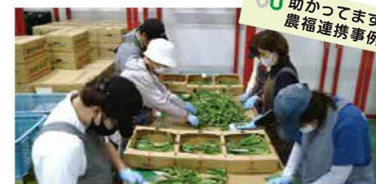
オクラの選別作業は決められたサイズに仕分けして箱詰めされます