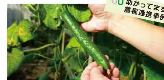
収穫できるサイズの“定規”を当てながら2人1組で作業します