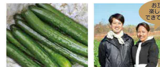
とても丁寧な作業で安心