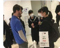
修学旅行で英会話体験