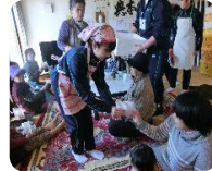
高校生とボランティア