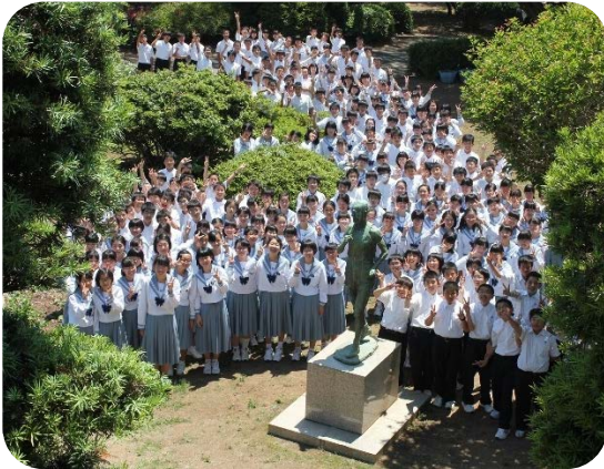
金栗四三像と全校生徒