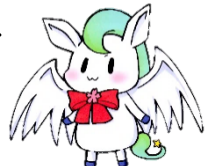
本校キャラクター わかごまる

県北の進学拠点校として、心を育て、全国難関大学等への進学を実現する。 夢実現・未来への挑戦～ENTERPRISE～