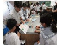
生徒主体の文化祭