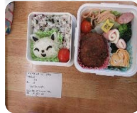
自分で作るお弁当の日