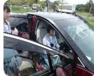
九州大学(水素自動車見学)