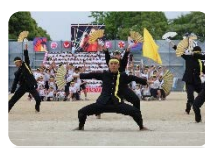
生徒主体の体育祭