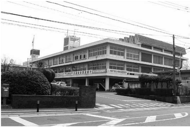
(市 役 所)