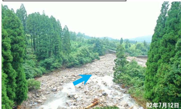
砂防ダム背面 土砂堆積状況

【砂防堰堤の徐石】 ゆ やまがわ 湯山川砂防堰堤(球磨郡水上村) く ま ぐん みずかみむら