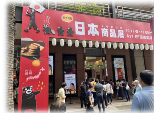
台湾での熊本フェア

○海外バイヤーの招へい、現地での「熊本フェア」等の実施に加え、タイでのトップセールスや台湾の輸出に向けた総合支援を実施し、積極的に販路拡大に取り組んだ。