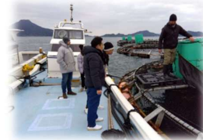
販路拡大に向けた、バイヤー招へい(漁場見学)の様子 (単位:千円)