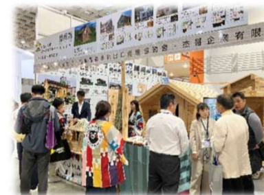
台北ビルディングショーへの出展の様子

最大の貿易相手国である中国に対し、丸太輸出が増加したこともあり、 輸出量、輸出額ともに過去最高となった。なお、輸出額は48億円(前年度比124%、9.2億円増額)となった。