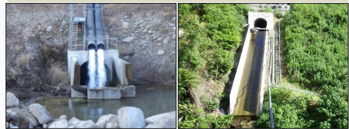
仮排水トンネル新設(完了)