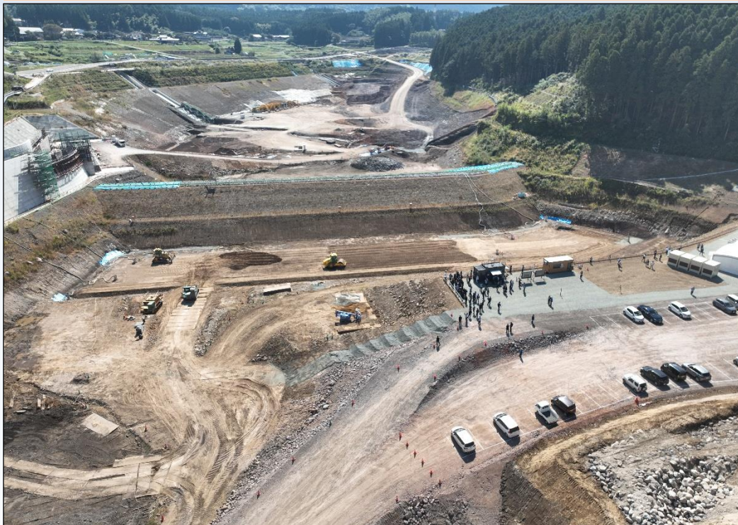
仮締切堤工、本堤工(盛立)