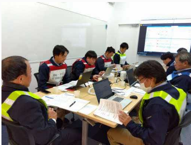
2023年度BCP運用訓練における災害対策本部の様子

今後も熊本県工業用水道への影響を最小化することを最優先とし、構成企業と一体となった災害対応ができるように努めてまいります。