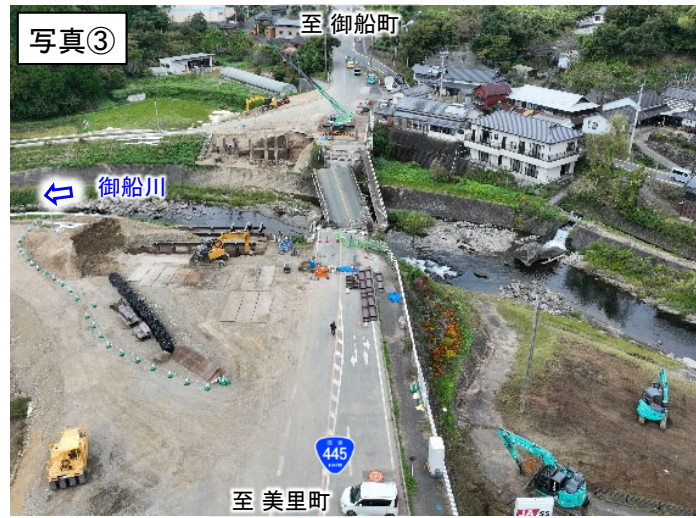
▲ 仮橋下部工の基礎杭施工中