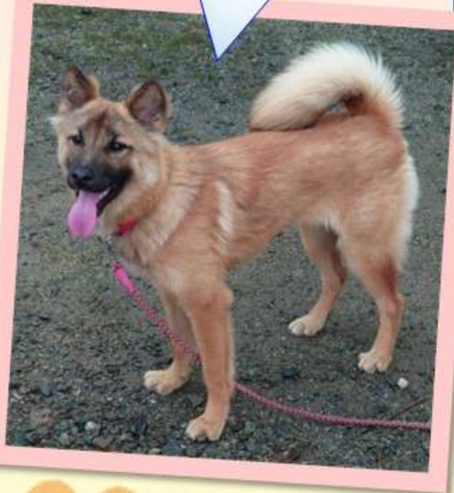
元気、だけどとても怖がりさん

飼い主さんからのメッセージ 譲渡いただいた当初は警戒してケージの隅っこから動きませんでした。抱きかかえればおしっこを漏らしたりで、なれるまで根気強く、少しずつ距離を縮めていくようにしました。今ではベッドで体を寄せて一緒に寝るようになり、仕事から戻ると尻尾をフンフン振って歓迎してくれます。お散歩も大好きです。保護犬、譲渡犬はペットショップの犬よりも正直大変です。それでも絆はより深いものを築き上げることができると信じています。