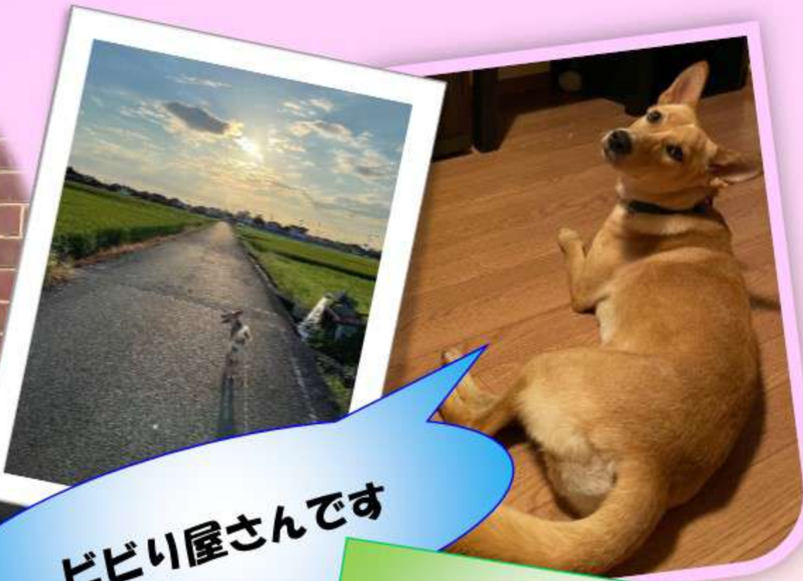
ビビり屋さんです