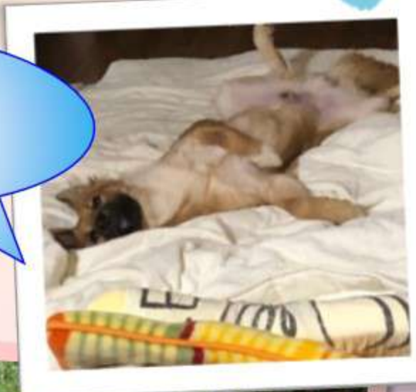
マイペースさんです