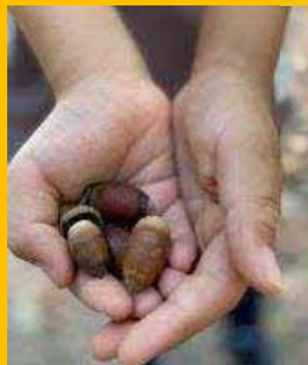
どんぐりクエスト