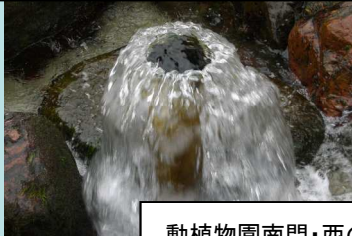
動植物園南門・西の湧水

熊本地域の健全な水循環と水環境保全の実現に向けて、広報啓発により県民・事業者等の地下水保全に向けた協働体制への参画を進め、本県の宝である地下水資源の保全と対外的なアピールに取り組みます。