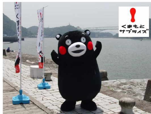
くまもとサプライズ

ふるさと納税制度による寄附控除は、毎年受けられます。したがって、この制度を活用し、継続して「ふるさとくまもと」を応援していただくことができますので、平成23年度もどうぞよろしくお願いいたします。