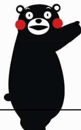
くまもとサプライズキャラクター「くまモン」