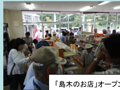
「島木のお店」オープン

政令市移行後を見据えた地域の活性化を目指し、市町村や地域住民の自主的な地域づくりを効果的に後押しするため、移住・定住や雇用、交流拡大等に資する取組みを総合的に支援します。