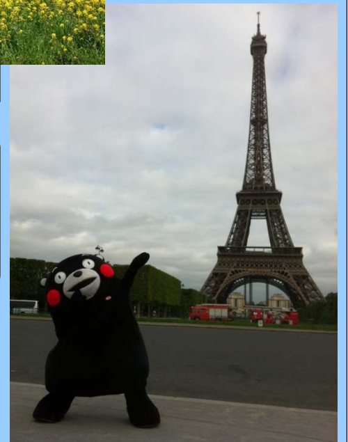
エッフェル塔とくまモン(フランス)