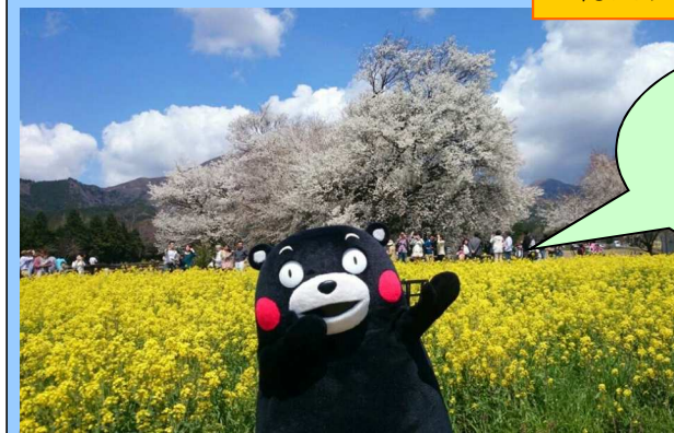
一心行の大桜とくまモン(南阿蘇村)