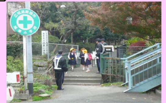
小学校における見守り活動

自転車盗やオートバイ盗などの抑止 金融機関やコンビニエンスストア等の警戒 小学校周辺及び通学路における子どもの安全確保のための声かけや見守り活動など