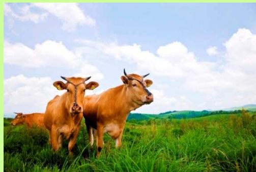
阿蘇の草原とあか牛