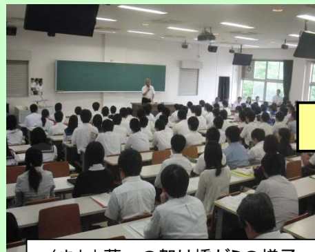
くまもと夢への架け橋ゼミの様子

医学等の分野で活躍中の研究者を講師に招き、生徒の学習意欲の高まりや学力向上のヒントにつながる講演会等を実施。