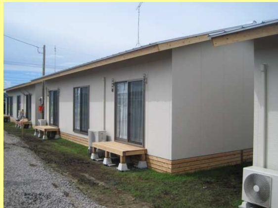
阿蘇市応急仮設住宅

平成24年7月12日に発生した熊本広域大水害において、被災者に対する支援として、応急仮設住宅の供与や阿蘇市に建設した木造応急仮設住宅の基礎改修を実施します。