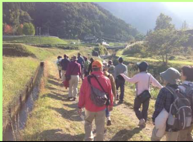
フットパス全国大会開催の支援（美里町）