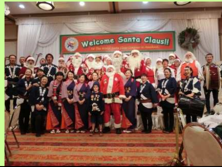
世界サンタクロース会議開催の支援（天草市）

市町村や地域の方々の自主的な地域づくりの取組みや、市町村域や県境を越えて連携した取組みを総合的に支援します。