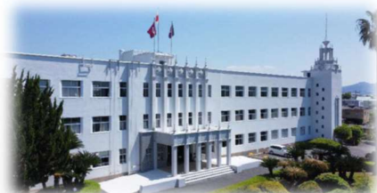
創立120周年を迎える「白亜の殿堂」