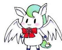
本校キャラクター わかごまる