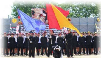
全校生徒で丸となった体育祭演舞！