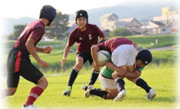
勉強も部活動も全力投球！