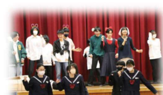
校内グローバルディ発表会・英語劇に挑戦！