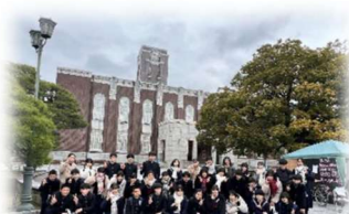
京都大学訪問と模擬授業で知的好奇心を刺激！