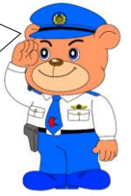
熊本県警察マスコット ゆっぴー