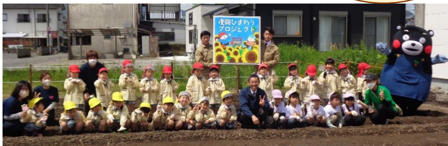
令和5年(2023年)4月27日撮影