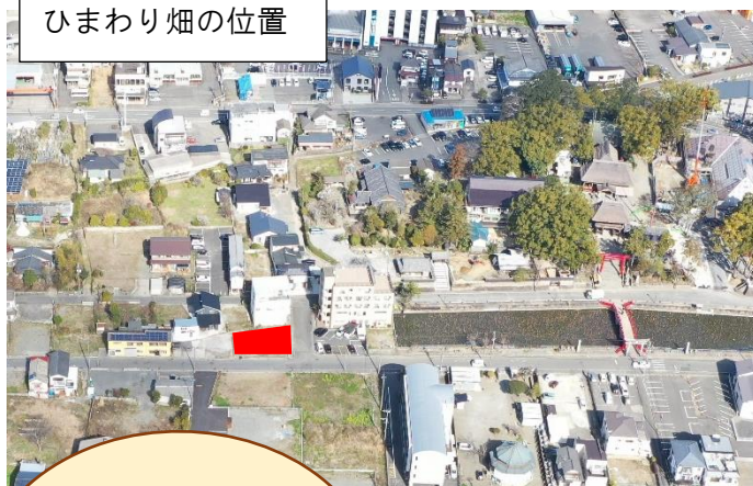
ひまわり畑の位置

4月27日（木）に、地元「青井幼稚園」と「ひまわり保育園」の園児の皆さんに種まきを行っていただき、ひまわりのように希望に満ちた明るいイベントになりました。