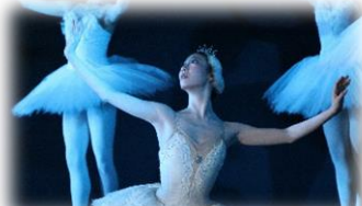
「本物」に触れ、感性を磨く