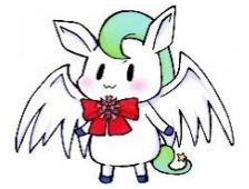
本校キャラクター わかごまる