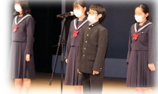
プレゼンや発表の授業も豊富!!