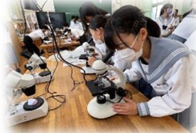
夏休み講座で知的好奇心を刺激