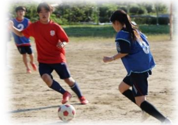
勉強も部活も全力投球！