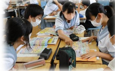
自ら考え、アイデアを出し合う授業