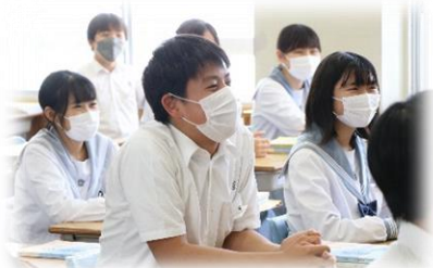
個性豊かな仲間と楽しく学べる！

世界に羽ばたくリーダーの育成を目指し、心を育て、全国難関大学等への進学を実現する。 夢実現・未来への挑戦～Challenge yourself-will～