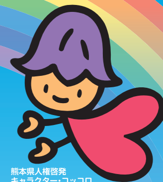
熊本県人権啓発キャラクター・コッコロ