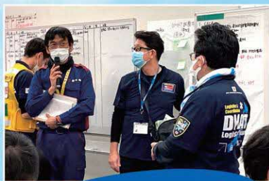
九州 DMAT 研修訓練