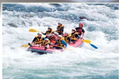
ラフティング (人吉球磨地域)