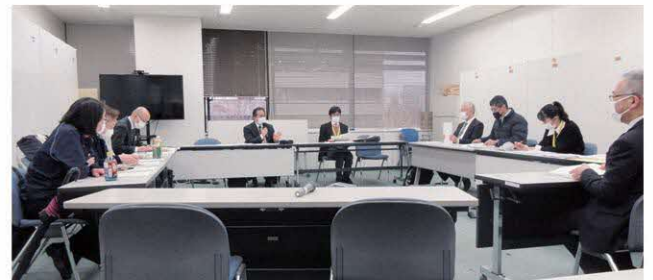
熊本県保健所長会の様子

熊本県は、ご出身じゃない方も住みやすい土地です。阿蘇はいるだけでパワーをもらえますし、天草では絶品の海の幸が楽しめます。人吉は別名「おひとよし」と呼ばれ、温泉もあり身体も心もぼかぼかになります。熊本県で働いてみようかな?と思われたら、お気軽にご相談ください。お待ちしております!