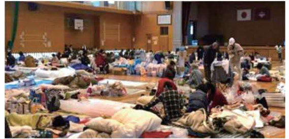
平成28年 熊本地震 避難所

時代や社会の変化の下で行政の医師の担う役割はダイナミックで退屈する暇はありません。知識や考え方を学ぶ研修の機会はしっかり提供されます。チームワークを常に意識し各方面のサポートを得ながらの業務は「やりがい」にあふれています。ご興味をもたれたら、ぜひ熊本県に連絡ください！