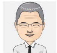
保健所勤務の公衆衛生医師 とある一週間のスケジュール

また、災害発生時には、保健所に地域の保健医療福祉調整本部が設置され、保健所長は指揮官として災害対応にあたります。