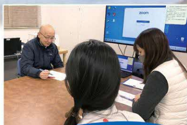
保健所内打ち合わせ