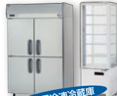
業務用冷凍冷蔵庫