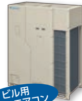
ビル用 マルチエアコン