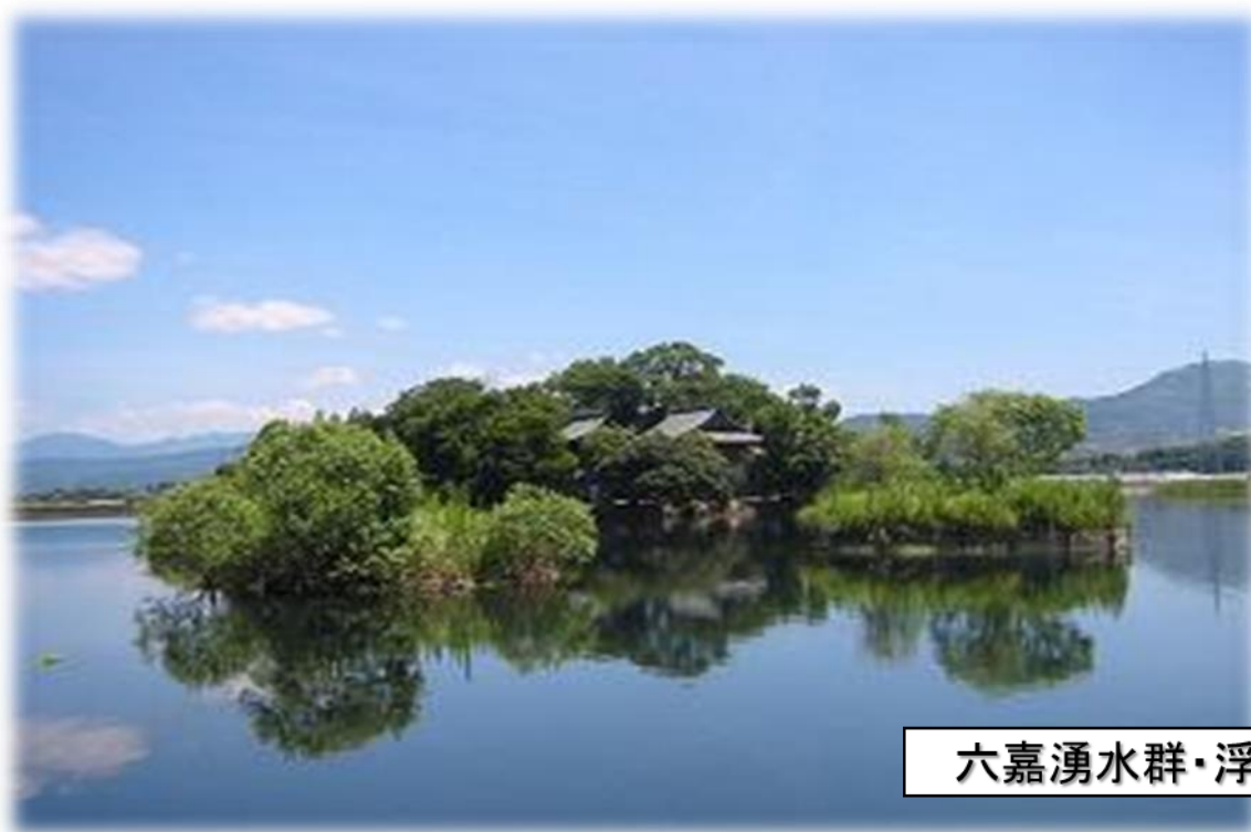
六嘉湧水群・浮島