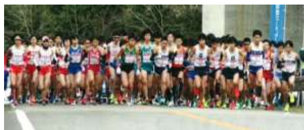
公認奥球磨ロードレース大会