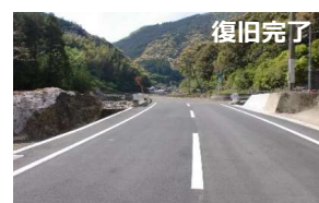
県道芦北坂本線(芦北町大岩)