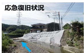
宮の浦川(芦北町宮浦)