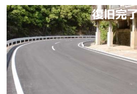
県道球磨田浦線(芦北町吉尾)