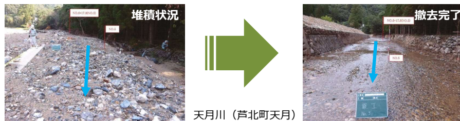
天月川(芦北町天月)

○7月豪雨の影響等により、芦北町内の県管理河川に堆積した土砂のうち、特に緊急に撤去が必要な土量、約9万m 3 (14河川)を5月末までに撤去。