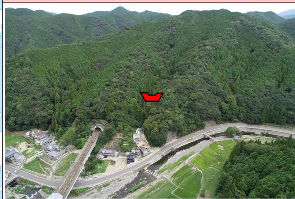
⑤ 管無田川 (芦北町桑原) 砂防えん堤