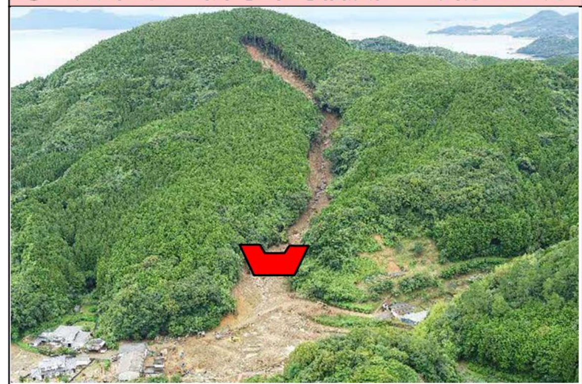
① 大坪川1 (津奈木町福浜) 砂防えん堤