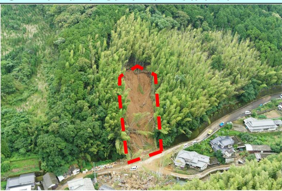
⑨ 上村 (芦北町伏木氏) 斜面对策