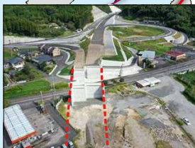
南九州西回り自動車道(R1年10月現在) 水俣C～袋IC