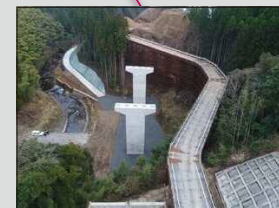
九州中央自動車道(R2年1月現在) 山都中島西IC～矢部IC