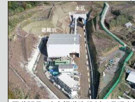
国道57号 滝室坂道路(R2年1月現在)