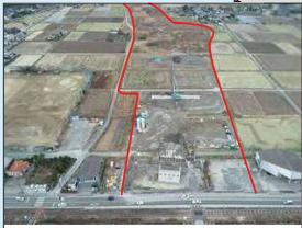
国道57号 熊本宇土道路(R1年12月現在)