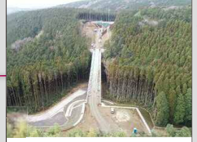
国道57号 北側復旧ルート(R2年1月現在)