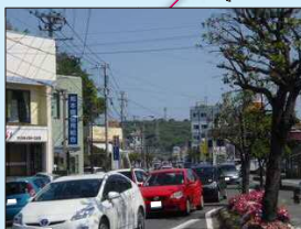
国道266号 大矢野道路 現道の渋滞状況