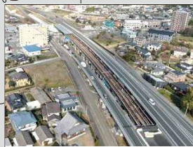
国道3号 熊本北バイパス(R2年1月現在)