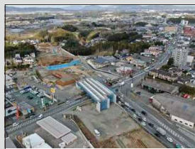
国道3号 植木バイパス(R2年1月現在)