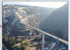
村道板の木～立野線 長陽大橋(R2年1月現在)