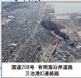
国道208号 有明海沿岸道路 三池港IC連絡路