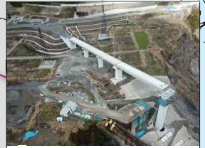
国道325号 阿蘇大橋(R2年1月現在)