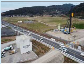
国道57号 宇土道路(R2年1月現在)