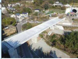
熊本西環状道路(R1年10月現在)