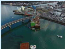
本渡道路(R2年1月現在)