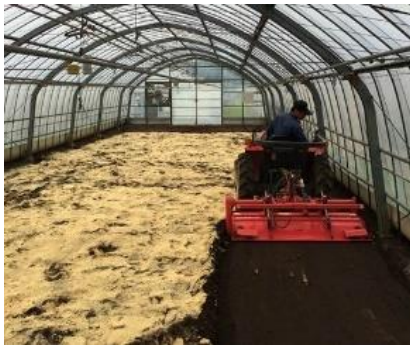
米ぬかのすきこみ による土づくり