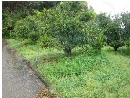
草生栽培による 土壌浸食防止