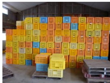
出荷コンテナを 衛生的に管理