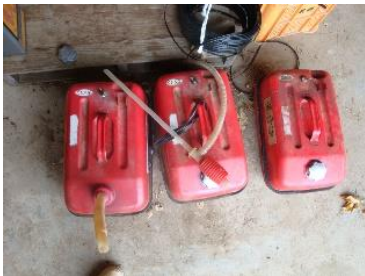
ガソリンは金属製の容器に入れる