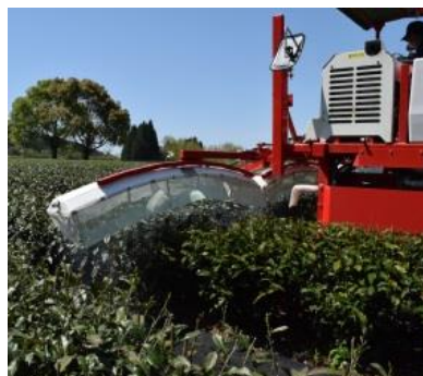
ドリフト低減カバー