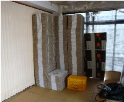
出荷資材は衛生的に保管

農産物が包装資材を通じて汚染されないよう、包装容器や出荷資材を衛生的に保管し、清潔な状態で使用するようにします。