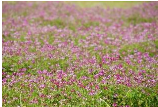
緑肥による土づくり