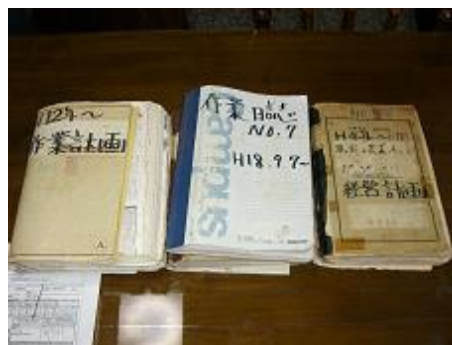
「GAP取組支援データベース」