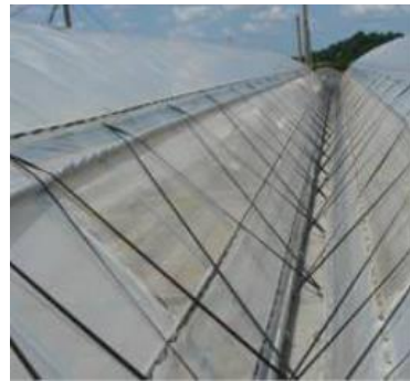
開口部のネット被覆