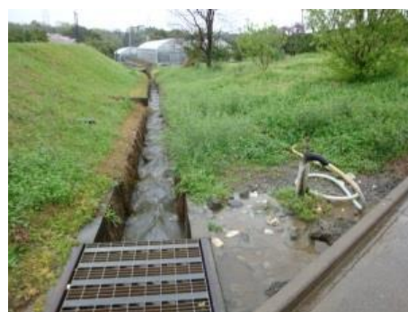
農薬や洗浄した水は河川や排水路に直接流さない