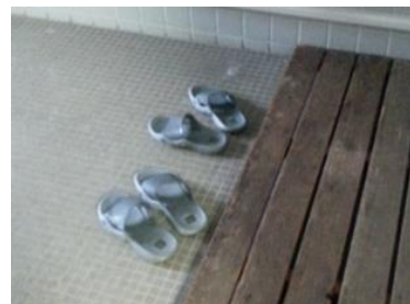
トイレ専用の履物