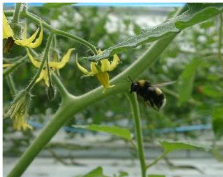
セイヨウオオマルハナバチ