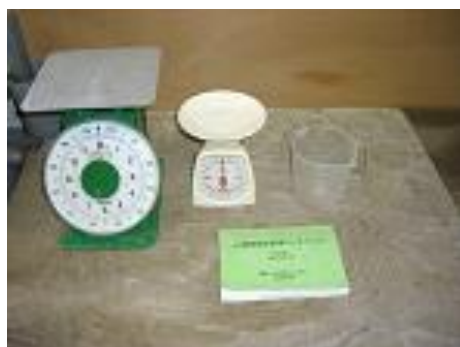
計量はかりや容器

環境保全のため、農薬の散布液が余ることがないように、必要な量だけを計って散布液を調製します。（経営改善にもつながります。）