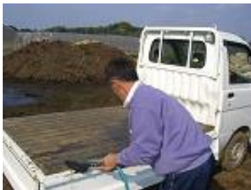
出荷用車両の荷台 はきれいに