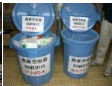
廃棄物等は分けて管理