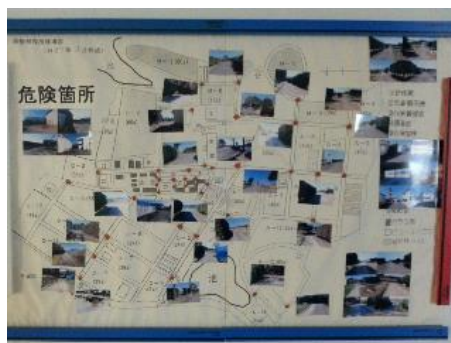
危険箇所の見取り図