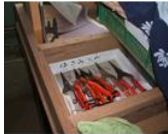
刃物（ハサミなど） はきちんと管理。