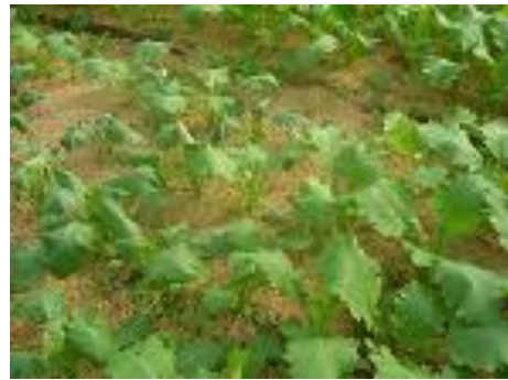
残さのほ場への還元）