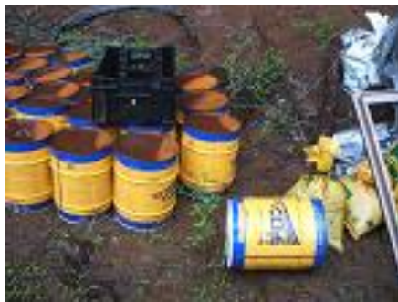
放置された農薬空容器（×）