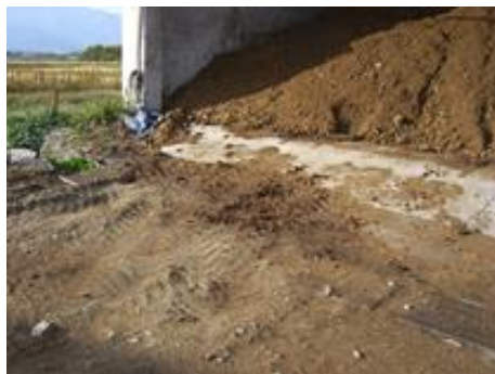
堆肥の散乱による汚染（×）

③汚染の疑いがある場合は、定期的な水質検査を実施し、大腸菌や有害物質が含まれていないか確認する。