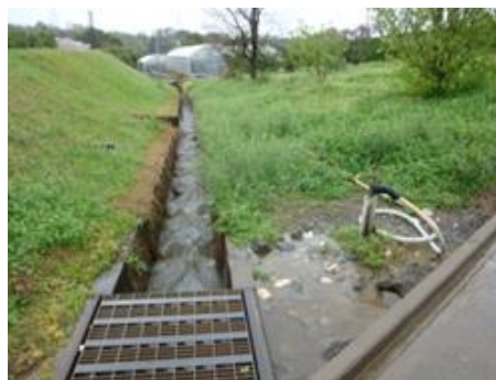
水路やバルブの確認