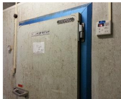
予冷庫の温度は定期的に確認