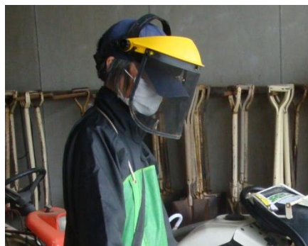
草刈用防災面の着用