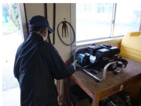
ノズルやホースの点検