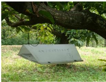
性フェロモン剤の設置

病害虫の発生予察情報等に基づき、耕種的防除（伝染病植物除去や輪作等）、生物的防除（天敵やフェロモン等の利用）、化学的防除（農薬散布等）、物理的防除（粘着版や太陽熱利用消毒等）を組み合わせた防除を総合的に実施し、病害虫の発生を抑制、管理する手法。