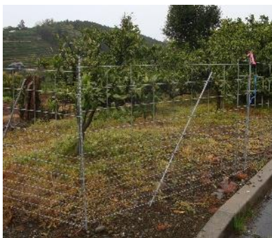
侵入防止柵の設置