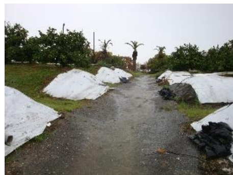
マルチによる 土壌侵食防止