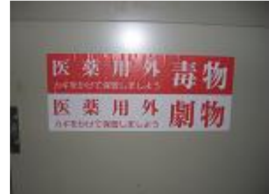
危険物の表示