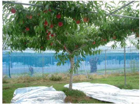
第2図 トンネルハウス栽培における‘はなよめ’の生育状況

注)・品種は‘日川白鳳’ ・2004～2006年の11月1日調査 ・トンネルは3樹、露地は2樹 ・肥大率は4年生に対する6年生の肥大割合