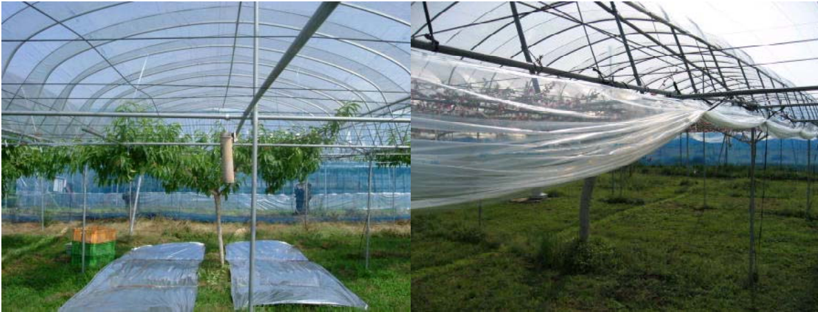
第1図 トンネルハウス施設の規格と費用（2008年5月現在）

なお、試験1～3におけるトンネルハウス栽培の温度管理や水管理、病虫害防除等については、熊本県のモモ加温ハウス栽培マニュアル 4) に準じて行った。温度については、サイドビニルの開閉（棚面高さ175cm）と谷部の開閉（50cm）で、可能な限り25℃を越えないように管理した。サイドビニルは低温障害の恐れがなくなった5月上旬（最低気温15℃前後）に除去し、天井ビニルは収穫直後に除去した。灌水は5～7日間隔に10～15mm（硬核期は5mm）ずつ行い、収穫約2週間前に停止した。