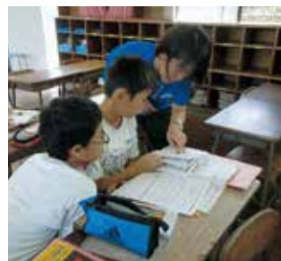
友達と使うと更に学びが深まる！