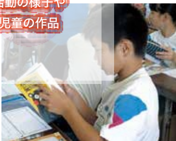
辞典の使い方を改めて復習！