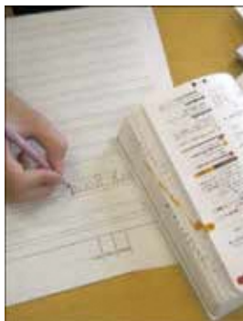
『くまモンじてん』で調べる児童