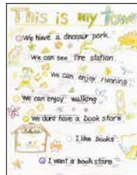
児童の作品ポスター②