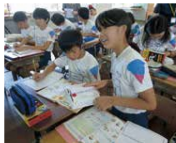
何より、調べるのが楽しい！