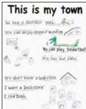
児童の作品ポスター①