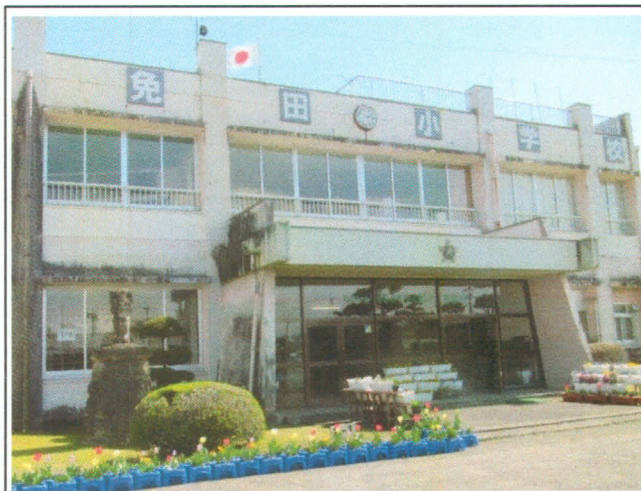
【あさぎり町立免田小学校】