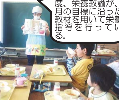
【栄養教諭による食育タイム】

各学級で月に1度、栄養教諭が、た月目標に沿った教材を用いて栄養指導を行っている。