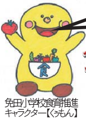
免田小学校食育推進キャラクター【うめん】