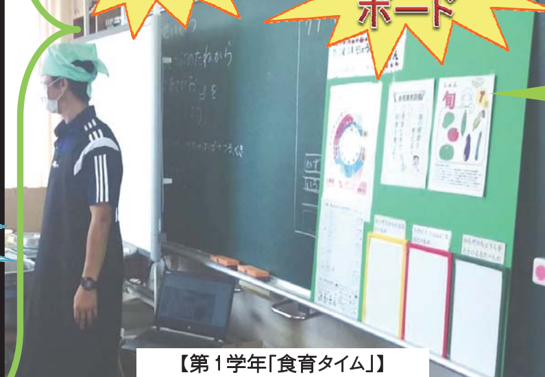
【第1学年「食育タイム」】