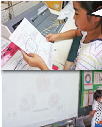
【子ども同士による食育タイム】

各学級で月に1度、栄養教諭が、た月目標に沿った教材を用いて栄養指導を行っている。