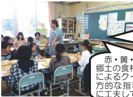
【担任による食育タイム】

担任は、栄養教諭が作成した「一ロメモ」を参考に、食育の6つの観点について理解を深めるための指導を行っている。