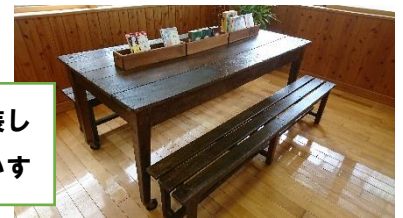
解体・組立・塗装し なおされた机・イス