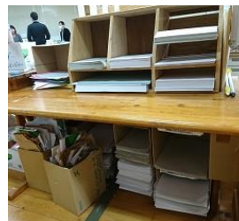
裏紙も用紙ごとに分類

また、机やイスなどで使わなくなったものも、職員が補修・塗装等を施すことで生まれ変わり、再度活用している。