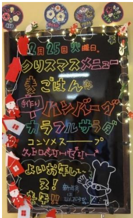
食欲をそそる献立ボード

本校では、ランチルームで全校生徒と一緒に給食をとっており、給食職員による工夫された献立は生徒の楽しみの1つとなっている。給食中は、給食委員会による食育と関連した放送や、講師を活用したランチタイム講話、生徒たちによる季節ごとのイベントの開催などで、より楽しい給食時間となり、残さいは毎日ゼロとなっている。