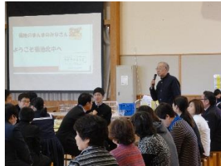
←ランチタイム 講話