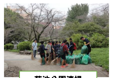
菊池公園清掃 (平成29年度)