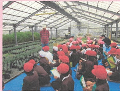
3年 トマト農家見学