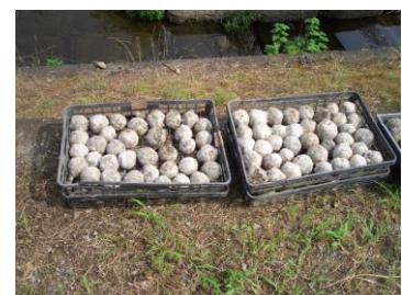
〈5年生によるEM泥団子作りと健軍川への投入〉