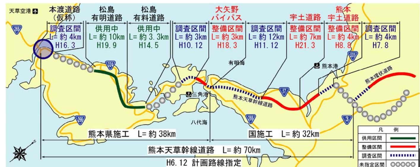
図-2 熊本天草幹線道路の整備状況

熊本天草幹線道路は、平成14年5月に「松島有料道路」約3.3km、平成19年9月に「松島有明道路」約10kmを供用し、全体で約13.3km区間をご利用いただいています。また、現在、熊本県が「大矢野バイパス」約3kmを、国が「宇土道路」約7kmと「熊本宇土道路」約4kmの整備を進めています。