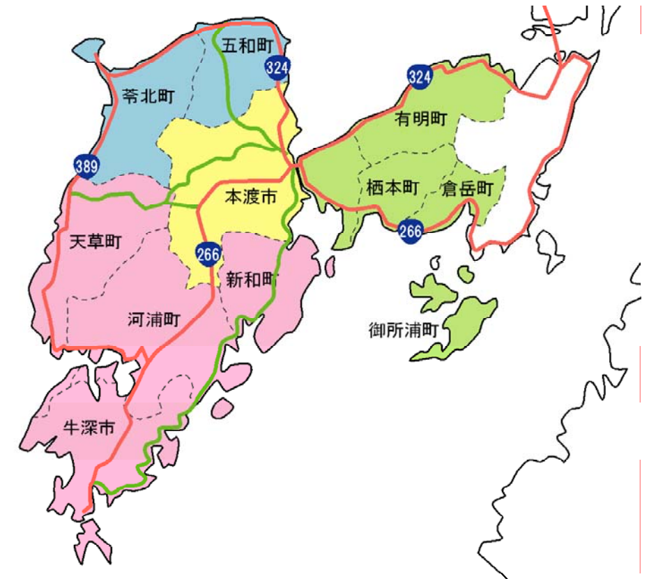
図-1 地域区分と主要な道路(天草市内は旧市町名)