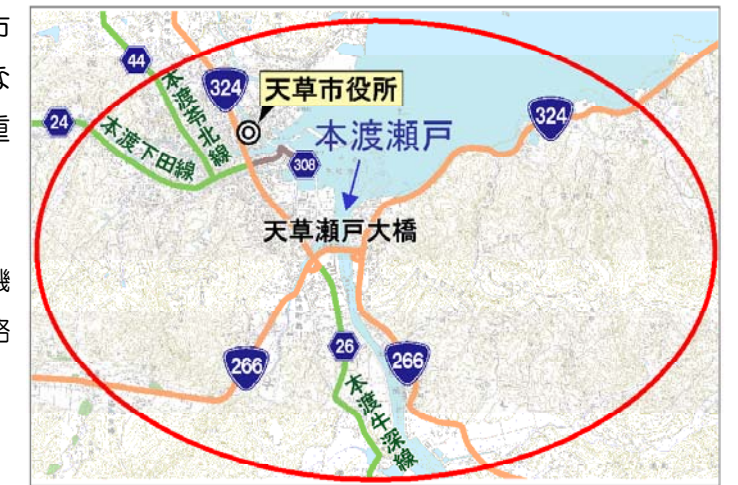
図-1 本渡道路(仮称)位置図

*地域高規格道路：自動車専用道路もしくは同等の機能があり、概ね60km/h以上で走行できる道路