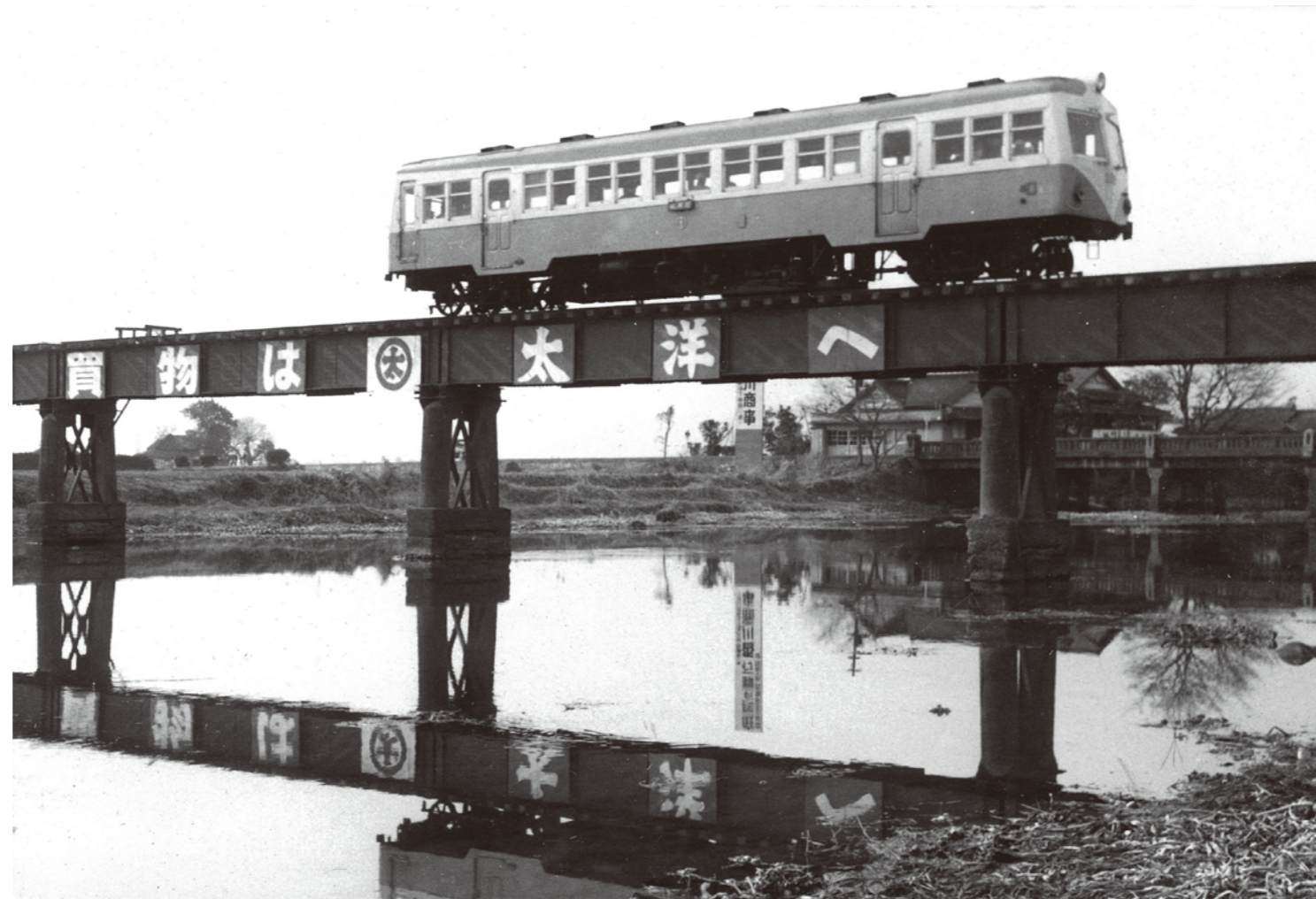
中の瀬-鯉間 / 撮影日 昭和36年2月23日 鉄橋の広告は、のち「大洋」に なる前の「太洋」百貨店時代