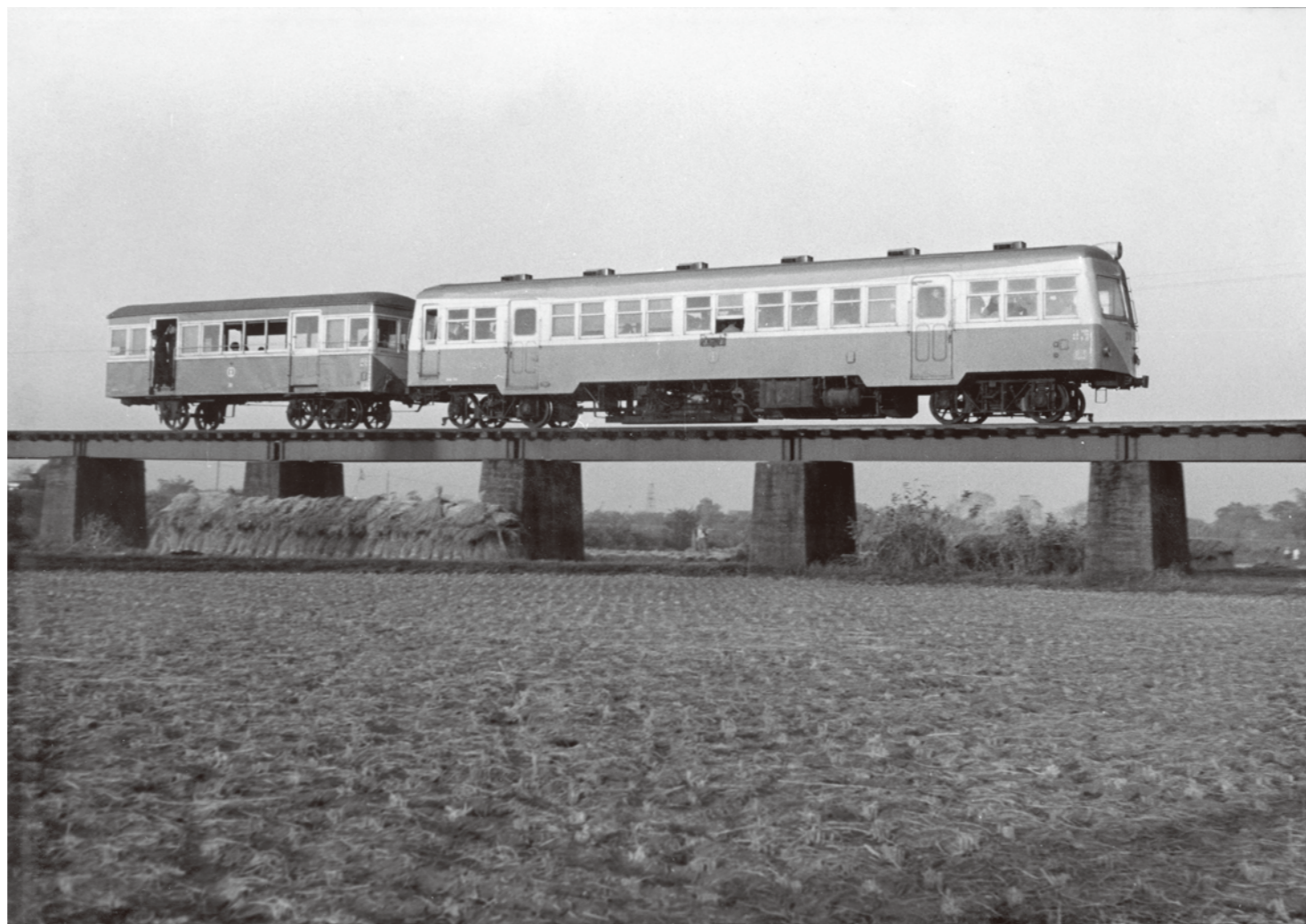
中の瀬-鯉間 / 撮影日 昭和38年11月5日 元ガソリンカーの片ボギー客車(左)が 増結され鉄橋を渡る