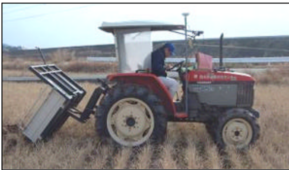
図2 トラクタダンプ搭載トラクタ