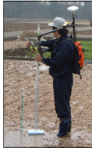
図4 均平度測定装置