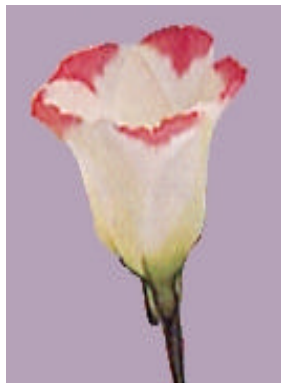
図1 供試品種「メロウローズピコ」の覆輪