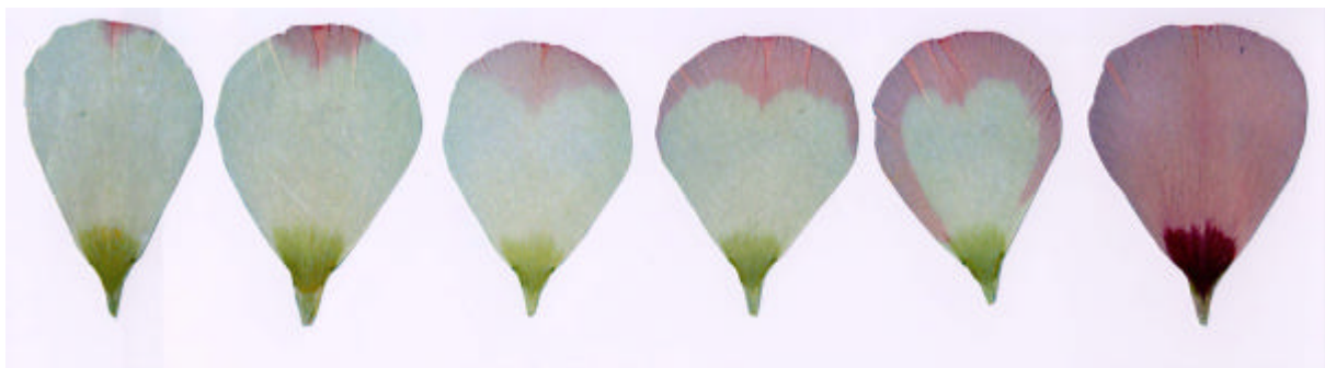
図2 覆輪の発現程度（左から着色割合3%、9%、20%、32%、49%、100%） 注：理想的な覆輪発現程度は着色割合5~20%程度である。