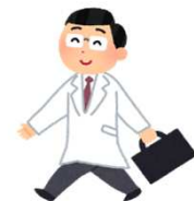
【地域在宅医療サポートセンターの指定先】