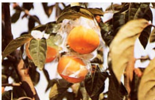
写真1 収穫直前の果実