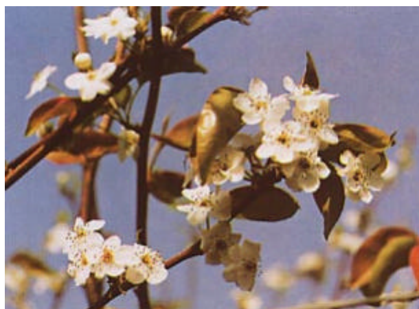
写真1 不時開花の状況