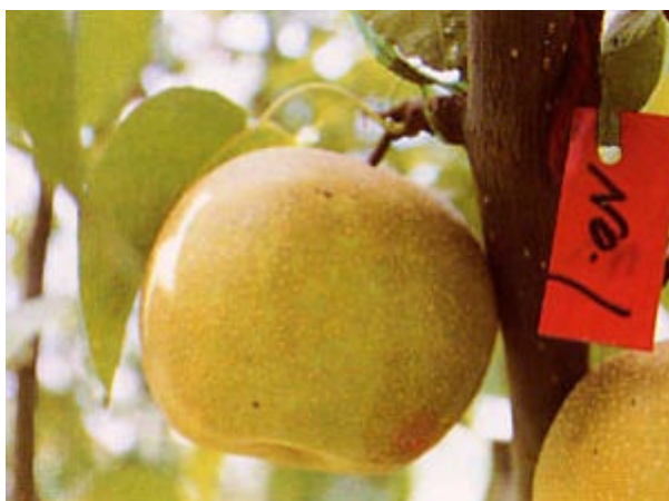
写真2 不時開花花粉による収穫前の果実（幸水）