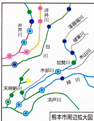
熊本市周辺拡大図