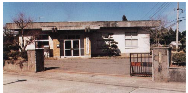
農業試験場阿蘇分場（昭和 60 年頃）