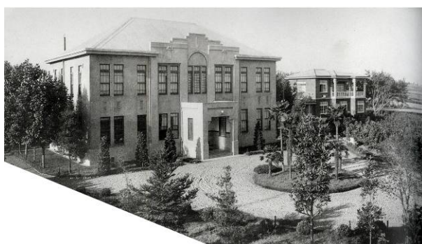
蚕業試験場（熊本市南千反畑町）（大正 11 年原蚕種製造所から改称）