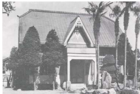
農業試験場球磨試験地 (昭和 27 年設立)