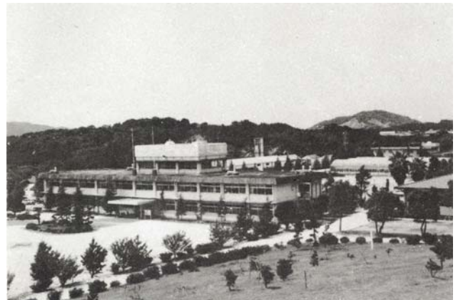
果樹試験場(下益城郡松橋町)(昭和 47 年)