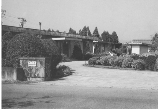
球磨農業研究指導所（昭和 59 年）