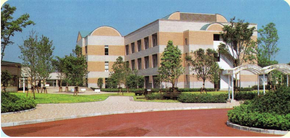
農業研究センター本部（農産園芸研究所、生産環境研究所、畜産研究所）（合志市）