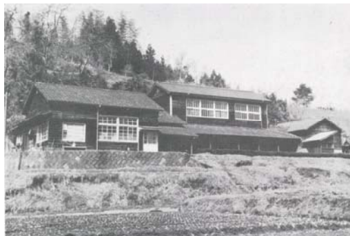
農業試験場矢部試験地 (昭和 27 年設立)