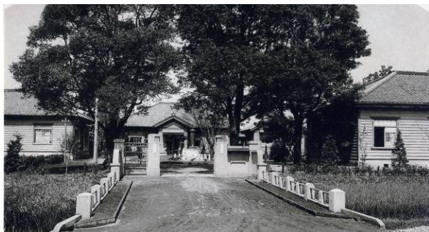
農事試験場（飽託郡出水村）（明治 44 年設立）