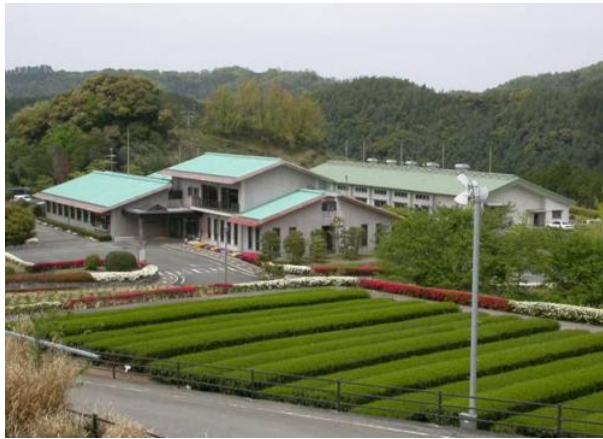
茶業研究所（御船町）