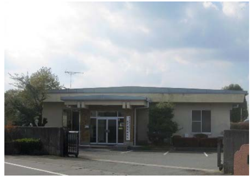
高原農業研究所（阿蘇市）