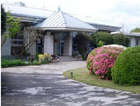
球磨農業研究所（あさぎり町）