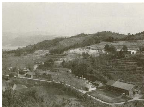
種畜場天草分場 (昭和 13 年設立)