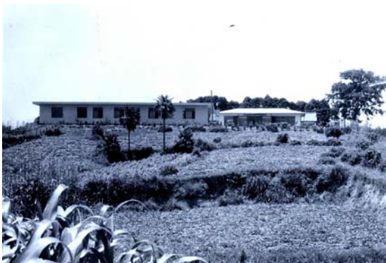
天草農業研究指導所(昭和 41 年)