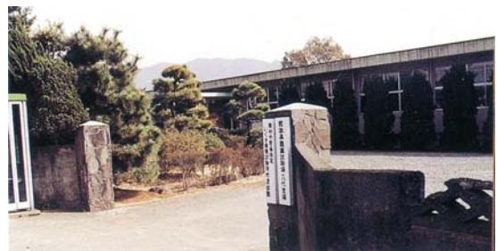
農業試験場八代支場（昭和 62～63 年）