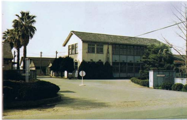
農業試験場本館（熊本市上の郷町）（昭和 60 年頃）