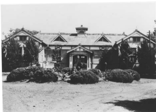
種畜場（菊池郡合志村）（大正 14 年）