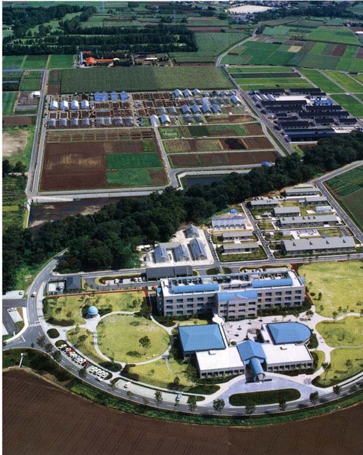
農業研究センター本部全景