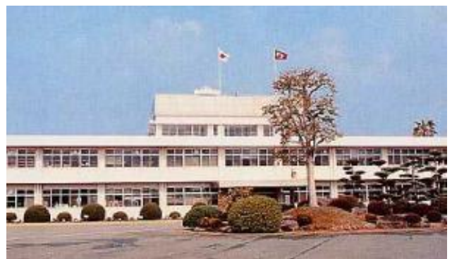
果樹研究所（宇城市）