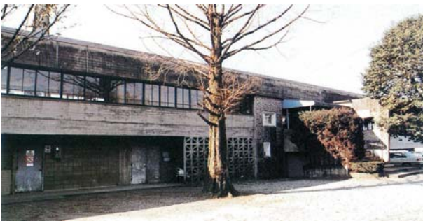
農業試験場園芸支場（菊池郡西合志町）（昭和 60 年頃）