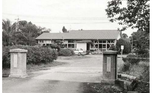
養鶏試験場(玉名市)(昭和 38 年～)