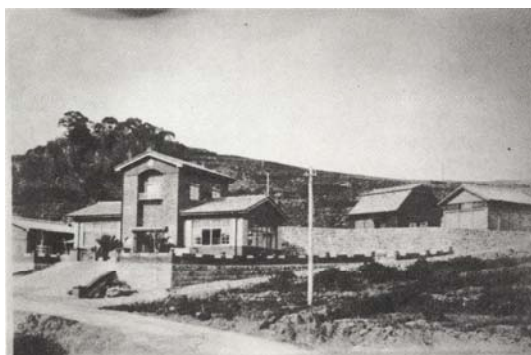
農事試験場柑橘試験地 (飽託郡河内村) (昭和 7 年設立)