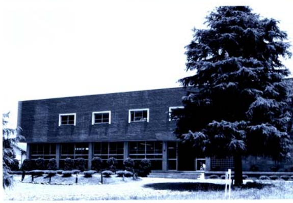
畜産試験場(菊池郡合志町)(昭和 37 年)