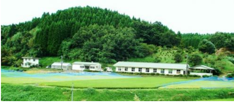
矢部試験地（山都町）