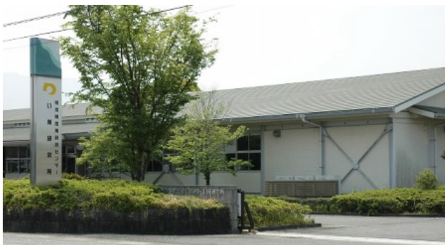
い業研究所（八代市）