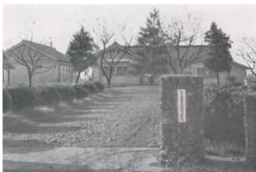
農事試験場阿蘇寒冷地試験地 (昭和 6 年再設立)