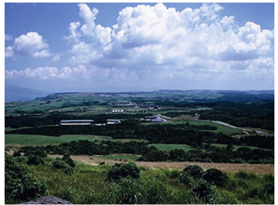
草地畜産研究所（阿蘇市）