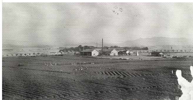
茶業試験場（研究所）（飽託郡健軍村）（昭和 12～13 年ごろ）