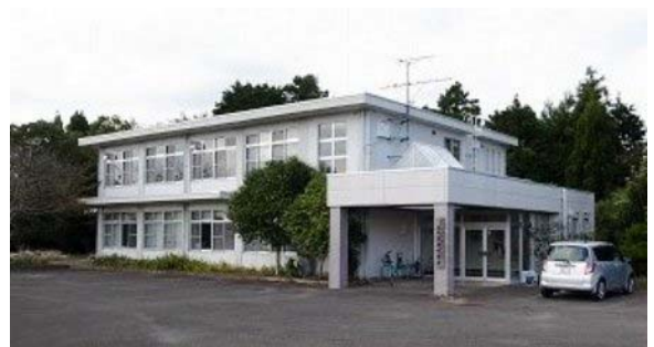
天草農業研究所（天草市）