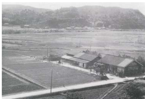
農業試験場天草試験地 (昭和 27 年設立)