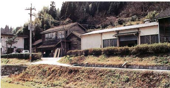
農業試験場矢部分場（昭和 60 年頃）