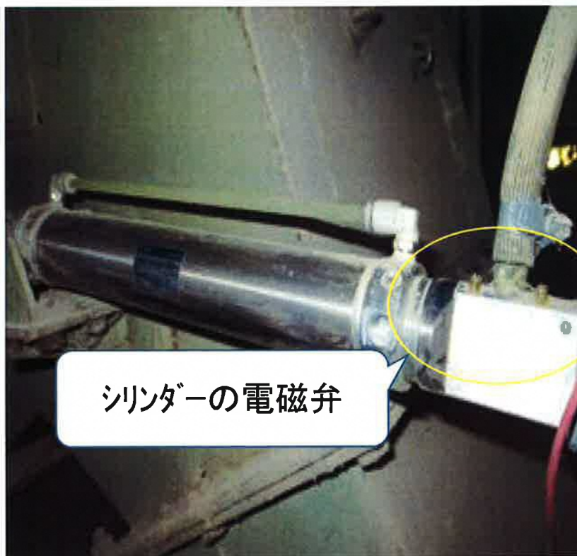
シリンダーからのエア漏れ