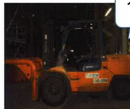
フォークリフトを 使って