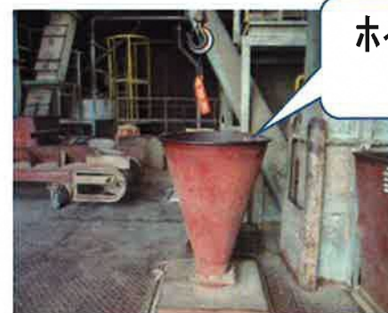
ホイスを使い 切込