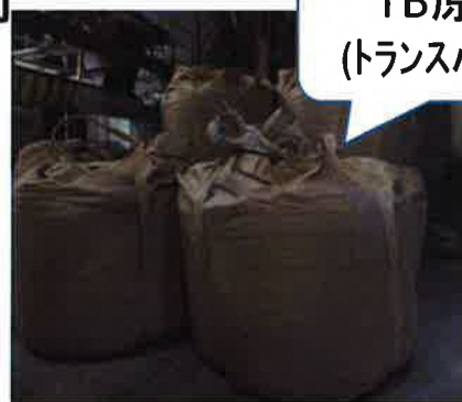
TB原料 (トランスバッグ)