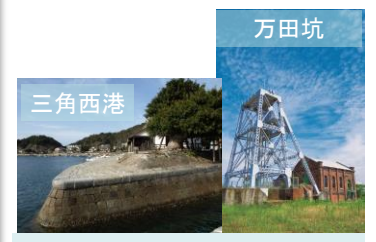
万田坑、三角西港を含む「明治日本の産業革命遺産」の世界遺産登録が実現