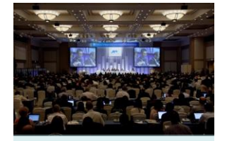
水銀に関する水俣条約外交会議