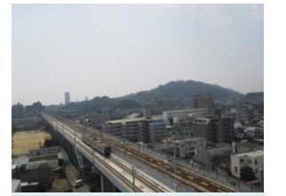
JR鹿児島本線高架切替