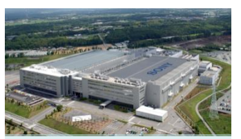
研究開発部門を中心とした企業誘致を推進