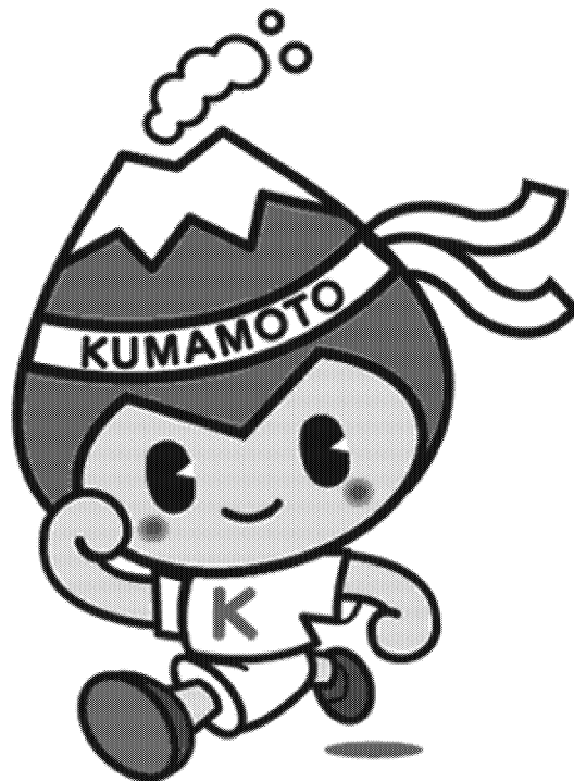
健やか生活習慣くまもと県民運動 キャラクター「ASO坊健太くん」