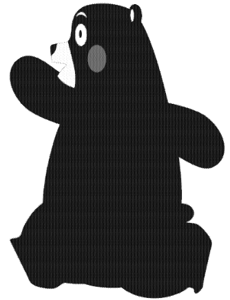
©2010 熊本県 くまモン