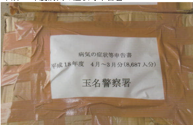
平成18年度病気の症状等申告書