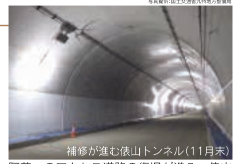
補修が進む俵山トンネル(11月末) 阿蘇へのアクセス道路の復旧が進み、俵山ルートは年内に暫定開通予定