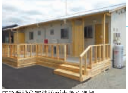
応急仮設住宅建設が大きく進捗