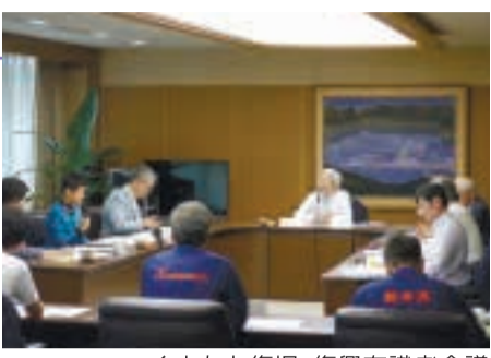
くまもと復興・復興有識者会議