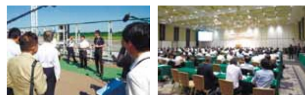
平成29年8月開催の阿蘇くまもと空港コンセッション現地見学会・セミナーの様子(126社202名が参加)。多くの企業が関心を寄せています。