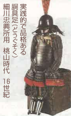
実践的で品格ある胸具足(なつこぞく) 細川忠興所用 桃山時代 16世紀

今回の展示のポイント 関ヶ原のみならず、全国各地の「戦場」などにスポットを当てて、細川家の活躍ぶりをご紹介します。ご期待ください。